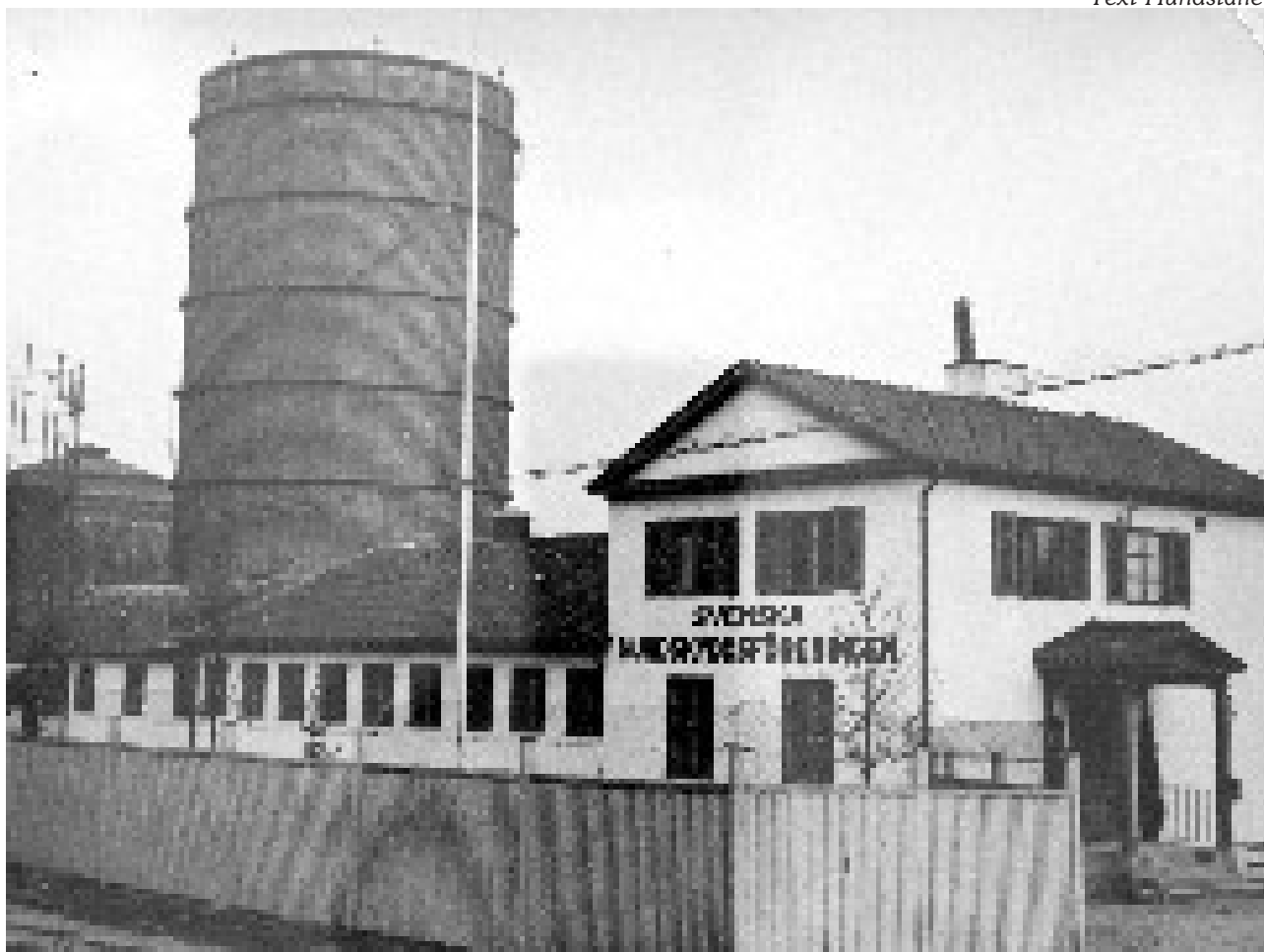
Hundstallet på Fiskartorpsvägen för länge sedan.