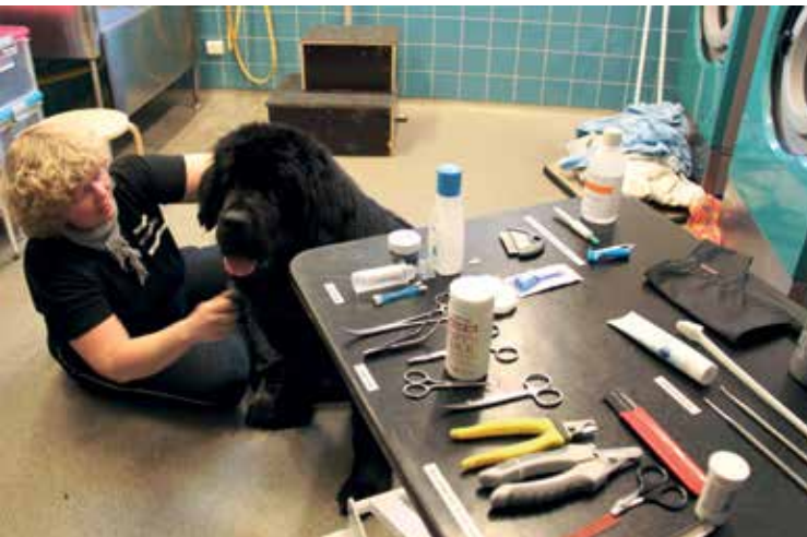
Alla hundar behöver pälsvård - mer eller mindre.