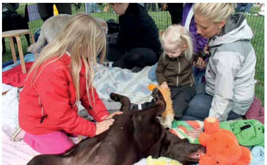
Kli på magen i Klapphörnan.