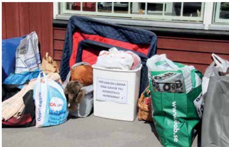
Tack för alla gåvor som kom in till Hundstallet under dagen.