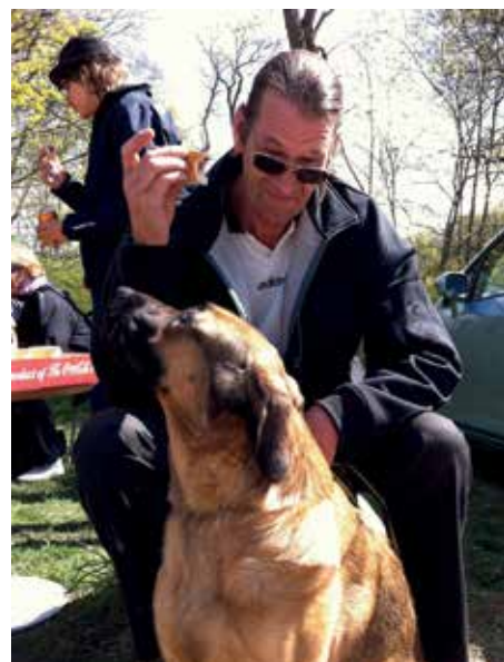
Korv åt alla.

Det är alltid ett stort intresse kring hur hundförarna jobbar med hundarna. Därför gavs också chansen att prata med Hundstallets hundförare och instruktörer, som delade med sig av träningstips och erfarenheter. Likaså gällde djurpolisen, vilka alltid väcker stort engagemang med sina berättelser från en tuff verklighet. Glädjande nog var det flera besökare som passade på att lämna in intresseanmälan för en hund och antalet doggywalk-aspiranter ökade också.