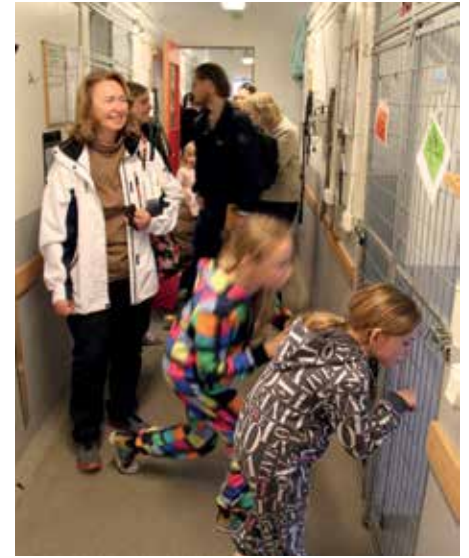
En titt i inneboxarna.