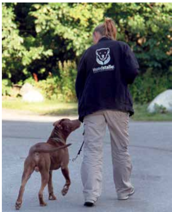
En doggywalker på promenad.

gåvor och autogiro. En månadsgåva ger Hundstallet möjlighet att säkra och planera verksamheten på längre sikt, vilket i sin tur leder till att fler hundar kan få en andra chans.