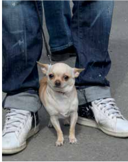
...och små hundar.