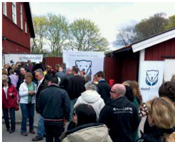
Entrén till Hundstallet.