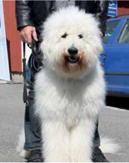
Det kom stora hundar...