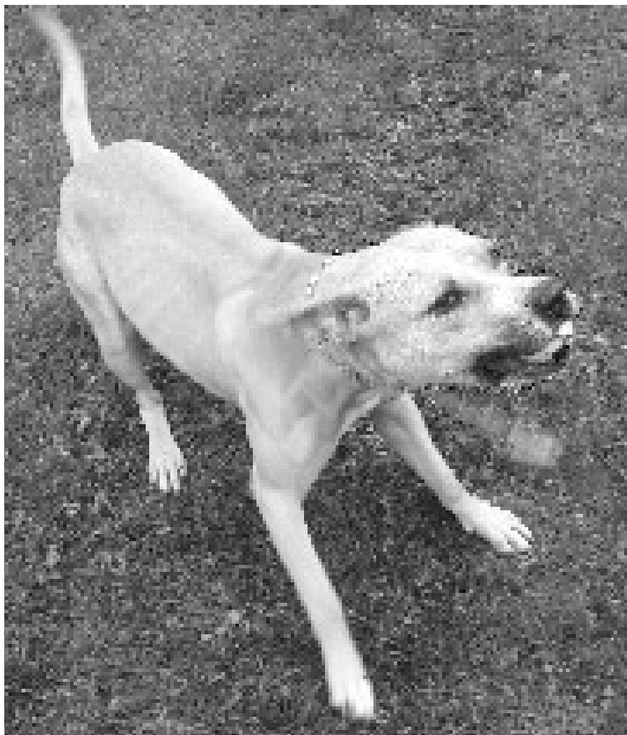
Dragon fick ha det bra på Hundstallet under sin sista tid i livet.

Han var alltid på sin vakt under promenaderna, och reagerade starkt