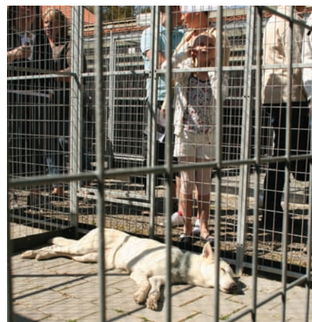
Öppet hus tröttar ut den starkaste. ▼