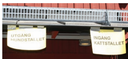
Gemensamt Öppet hus för ▲ Hundstallet och Kattstallet.