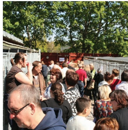
Många ville se hur hundarna bor. ▲

I Kram&Klapphörnan är läget raka motsatsen. Här ligger flera hundar på rygg och njuter av varsina skaror barn som öser kärlek och gos från fingertoppar till päls. Utanför den inhägnade gruppkramen passar föräldrarna på att lapa sol i gröngräset och njuta av en grillad korv från Hundstallets servering. Det är en intensiv njutning – nästa tillfälle ges ju inte förrän i höst.