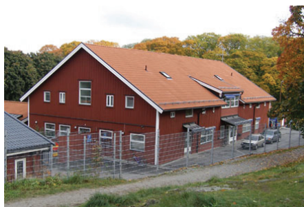
En trappa upp från Hundstallet ligger Kattstallet.