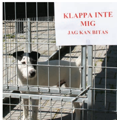
Man ska inte alltid döma hunden ▲ efter pälsen...