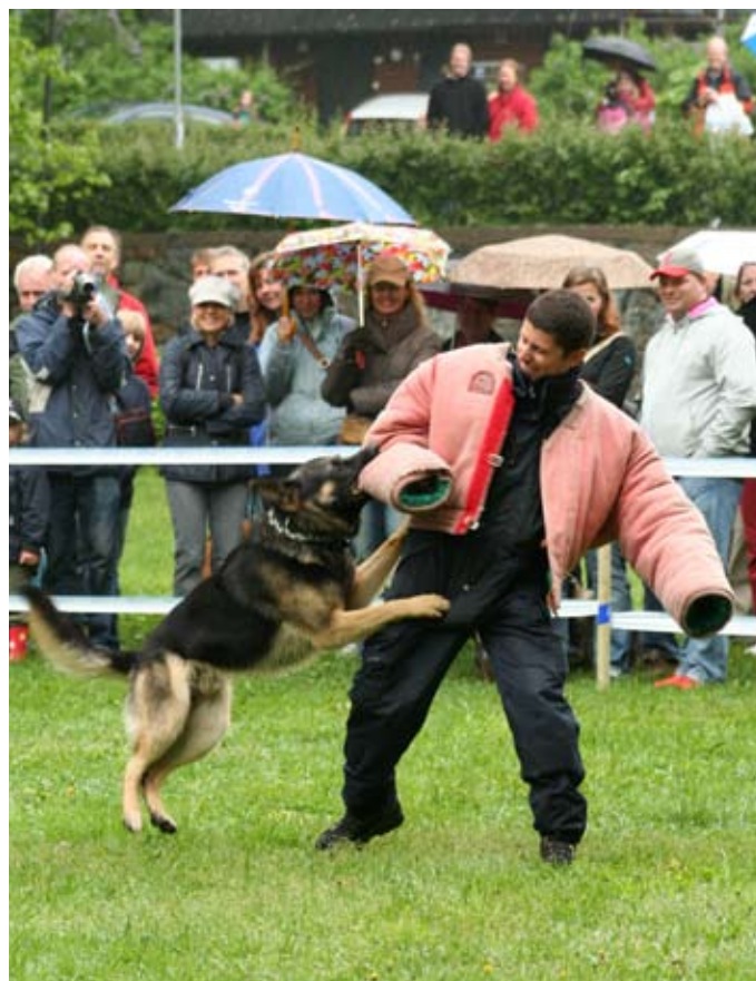
Polishundarvisar upp hur man fångar busar.

Både Polisen och Tullen har uppvisningar. Polishundarna fångar bovar. Vi är många i publiken och det är nog fler än jag som blir rörda och nästan tårögda över hur duktiga hundarna är. Flertalet av hundarna i publiken visar också sin support genom att hjälpa till med skällandet när "gärningsmannen" jagas rätt på och med skall uppmanas stå still tills hundförande polis kommit på plats.