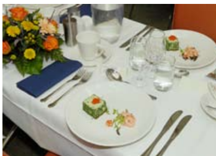
På festen serverades det mycket god mat och dryck.