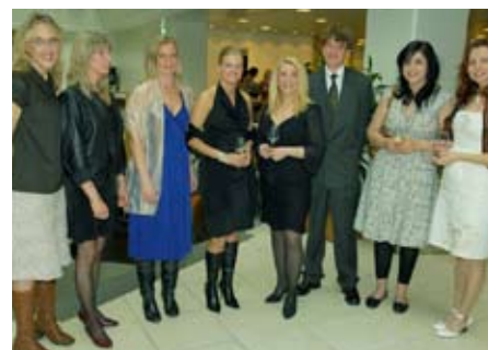
Så här festklädda är vi inte vana att se Hundstallets personal.