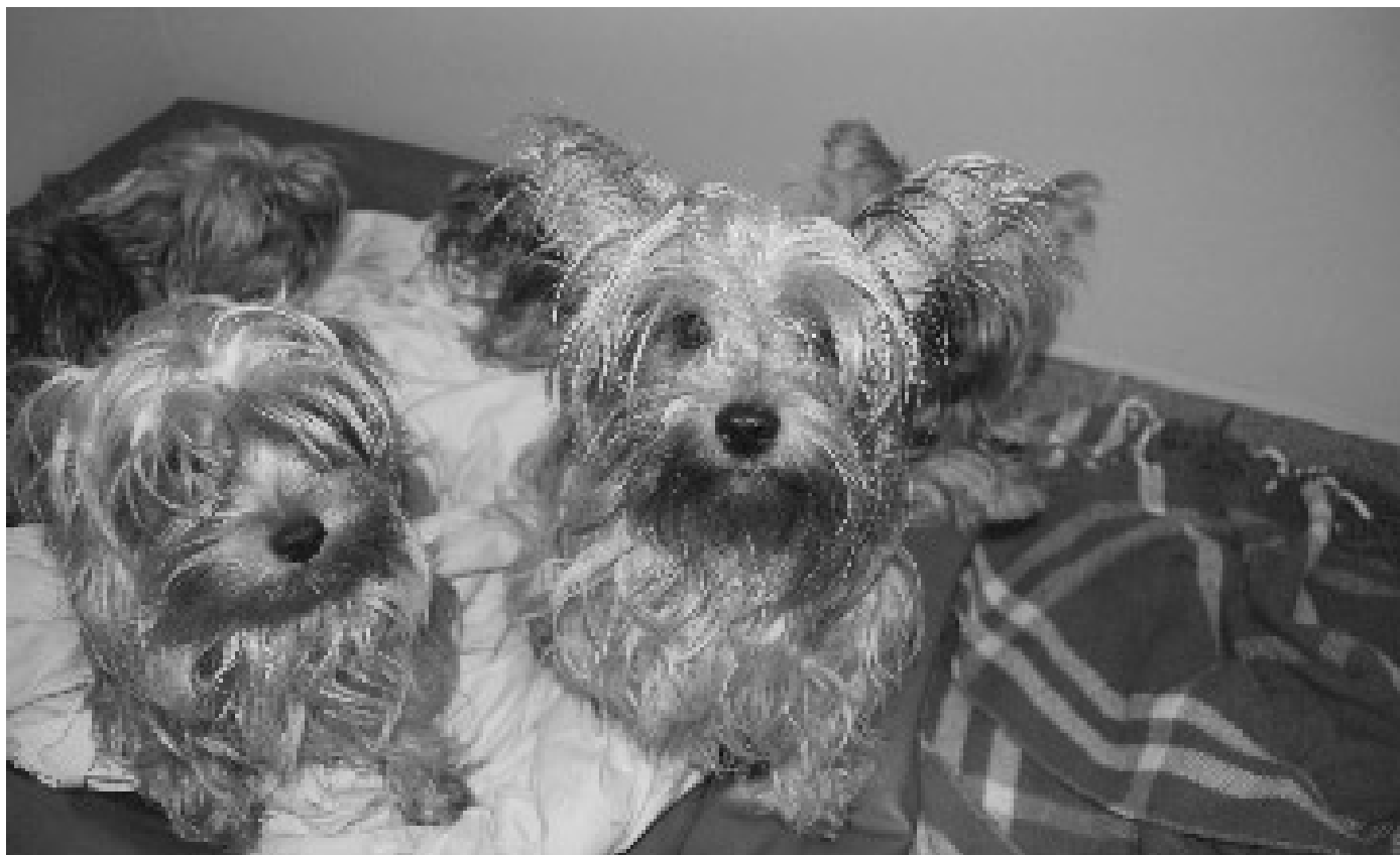
Några av de omhändertagna hundarna som nu får trygghet, omvårdnad och kärlek på Hundstallet.