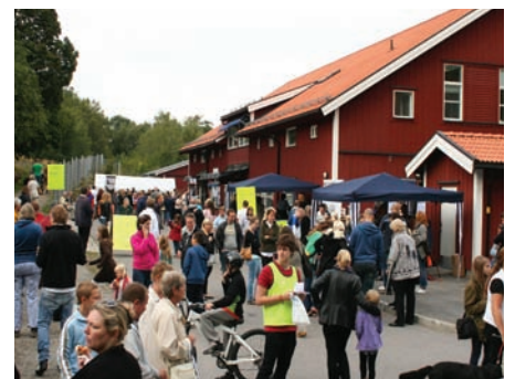
Höstens öppna hus gick av stapel den 6 september och var som vanligt välbesökt.