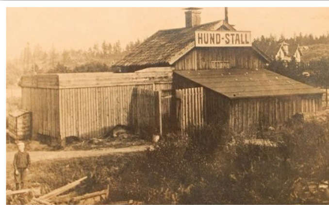
Hundstallet anno 1908

Hundstallet, som egentligen heter Svenska Hundskyddsföreningen, är en ideell förening som bildades år 1908. Så under drygt 100 år har alltså Hundstallet tagit emot hundar och hjälpt dem att hitta nya hem. Hundstallet låg från början på Östermalm i Stockholm, men huserar sedan ungefär 10 år i modernare lokaler i Åkeshov strax utanför stan.